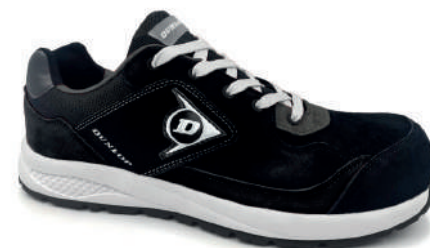
NEGRO / BLACK