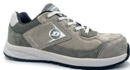
GRIS / GREY