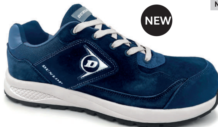
AZUL MARINO / NAVY BLUE