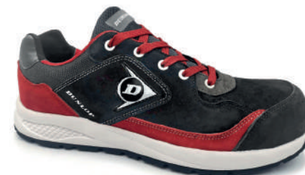
NEGRO / BLACK